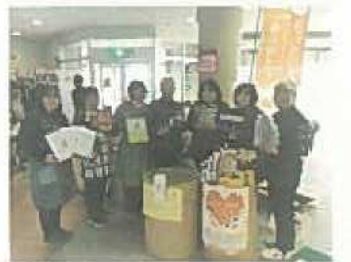
▲ボランティアの様子