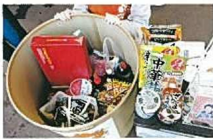
▲フードバンクポスト

ご寄贈・ご寄付いただいた岩手県内外の皆さま、フードバンクポストをご利用いただいた皆さま、企業・団体さまありがとうございます！