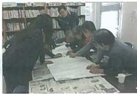
さみっと会議の様子

沙美小学校区で、開催される地域の課題を話し合う場、小地域ケア会議は通称「さみっと会議」と呼ばれています。