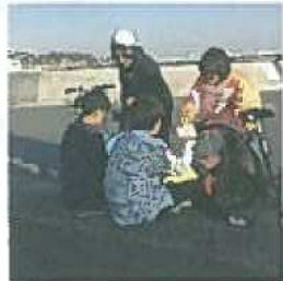
見守り・発見訓練の様子▶

「いつものまちで認知症の方に会ったら…」を想定して、発見訓練を実施。認サポの成果もあり、中学生や地域の方が、温かい声かけをしてくださいました。