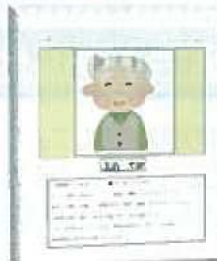
さみっと登録簿イメージ▲

また、事前に本人や家族に了解をもらい、顔写真や連絡先を書いた登録簿も作成しました。