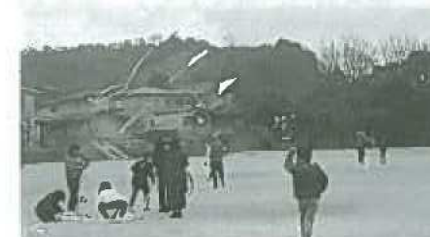
自作の三連凧を校庭でお披露目

今後も行事を通じての世代間のつながりが、ますます深まっていくことが期待されます。