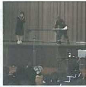
寸劇の生徒役は学校の先生です▲

小・中学生に向けた講座を開催。良く知っている地域の方や学校の先生が寸劇に登場し、認知症を身近に感じつつ、正しい理解にもつながりました。