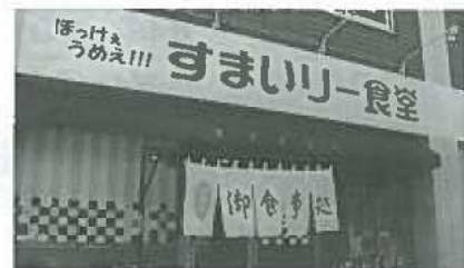
お店の看板はひらがなで「すまいりー食堂」

住所 老松町3-5-13 電話番号 424-0006 営業時間 11:00~14:00頃 定休日 土日祝 駐車場はお店の隣にあります