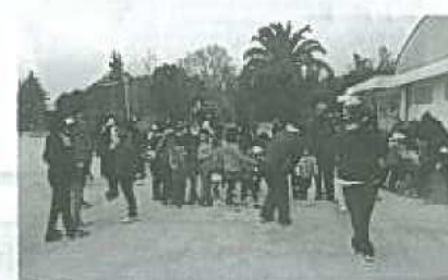
餅つきの順番を待つ、長蛇の列

2月3日の凧作りでは、凧クラブのメンバーや講習を受けた補助員が各グループに入り、きめ細かな指導をしました。