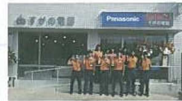
すがの電器 スタッフの皆さん