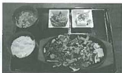
ボリューム満点のホルモン焼き定食