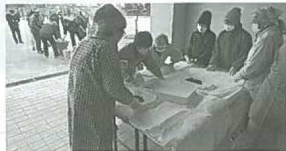
地区社協歳末事業(もちつき)の様子