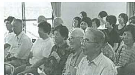
YOKOさんの軽快なトークに笑顔がこぼれます

復興に向けて一歩一歩前進し、被災前の日常を取り戻したいという意気込みが役員の皆さんから伝わりました。