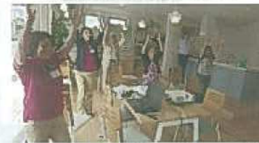
脳トレを兼ねた体操で、筋力アップ!