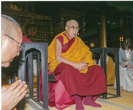
法話をされるダライ・ラマ法王

ところで、このたび法王様をお呼びした一番の目的は、2016年の熊本震災、2017年の九州北部豪雨、そして今年2018年の西日本