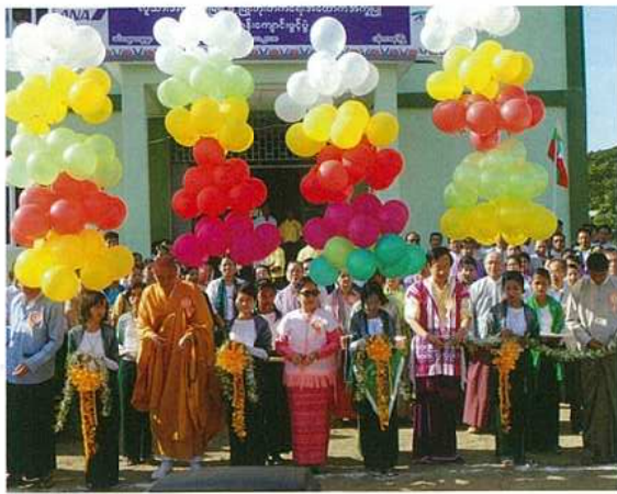
落成式でテープカットを行う専務理事(左から3番目)。