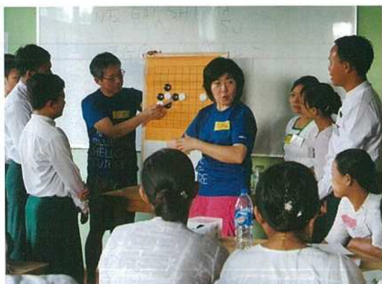
囲碁ゲームを使っでの研修

研修生として参加した先生達やイラワジ管区教育事務所関係者からは、「このようなアクティブな研修は初めてだ、とても楽しく、そして大変役にたった」と非常に高い評価を頂きました。