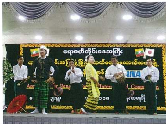
先生達自身も楽しい寸劇などを披露