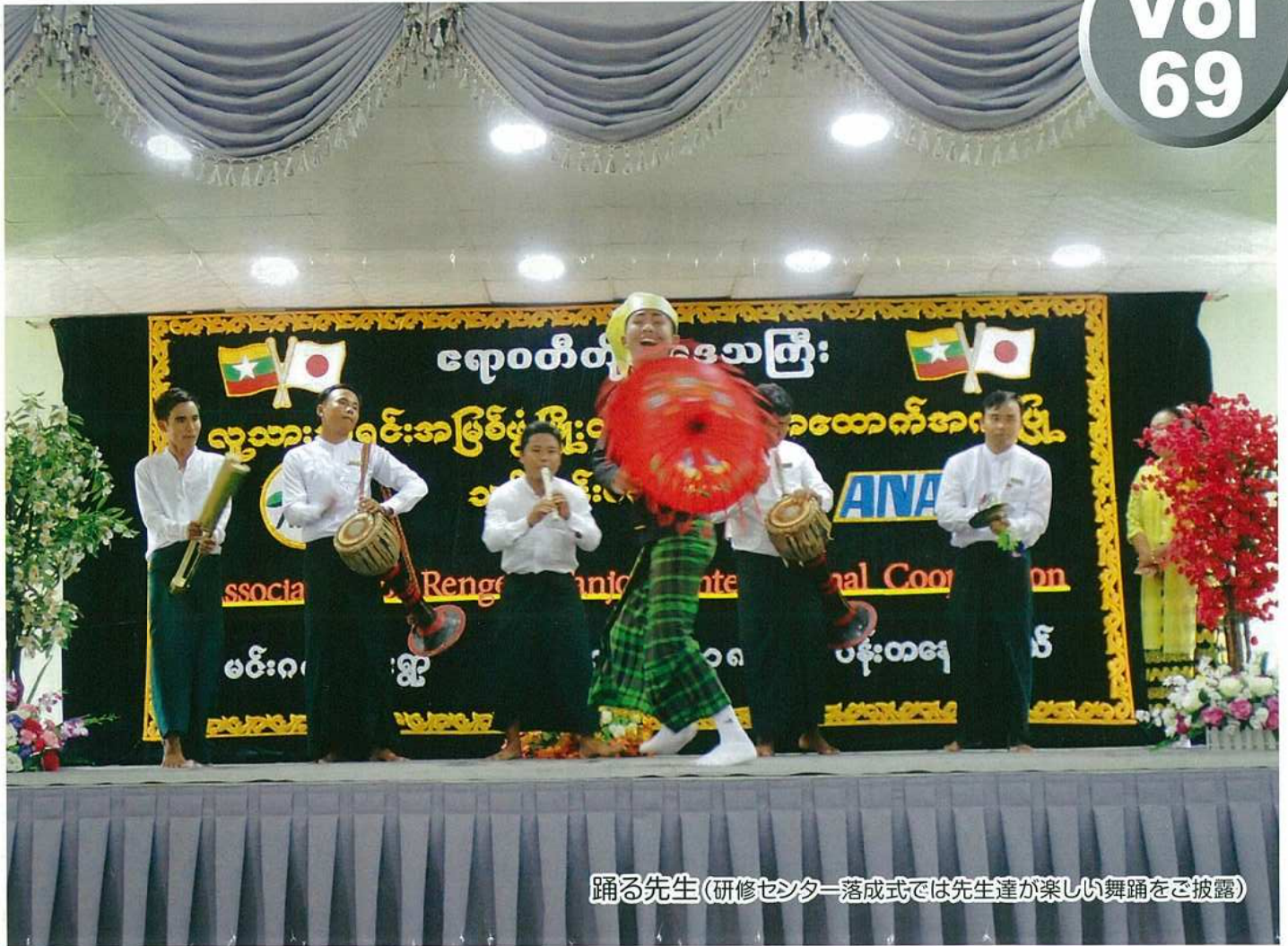
踊る先生(研修センター落成式では先生達が楽しい舞踊をご披露)