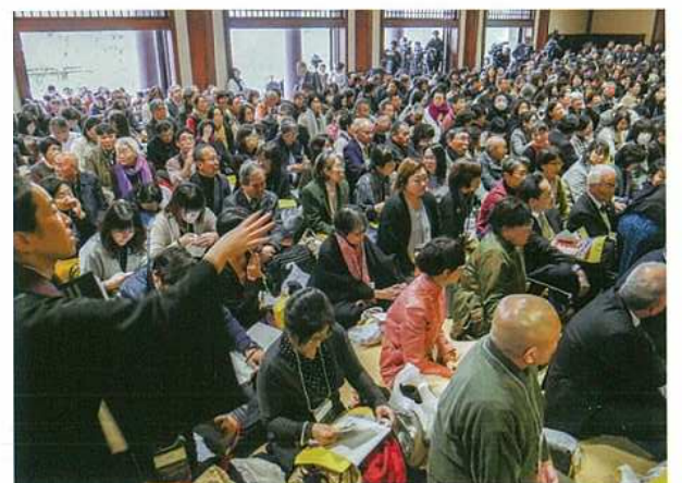
熱心に耳を傾ける聴衆

今年83歳を迎えられた法王様ですが、変わらず力強いご法話でした。お話の中で「日本には非常に大きな可能性がある。西洋文明の科学技術も世界をリードする程マスターし、しかも推進し新しい技術も次々と生み出す力も持っている。でありながら仏教の哲理をちゃんと昔から先祖伝来受け継いできている。この日本と言う国は世界に大きな希望を与え